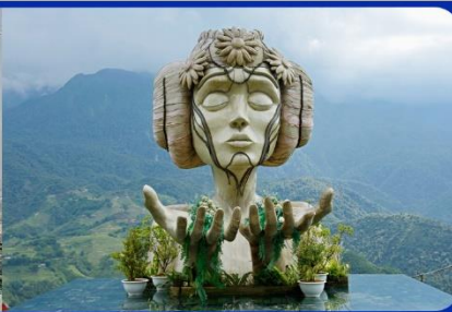
เชคอิน โมอาน่า (Moana Sapa Cafe)