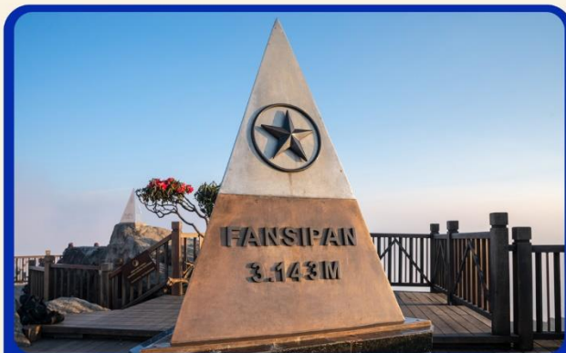
นั่งกระเช้าสู่ยอดเขาฟานซิปัน