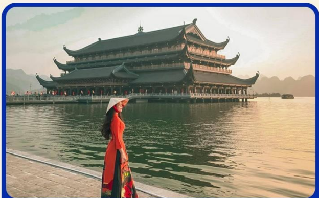
จุดเชคอินแห่งใหม่ “วัดตามจุก”