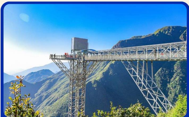
สะพานแก้วมิงกรมช (Rong May Glass Bridge)