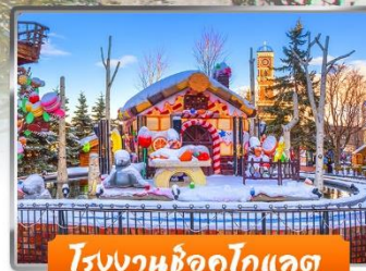
โรงงานช็อกโกแลต