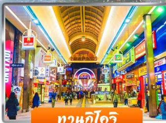
ทานุกิโคจิ