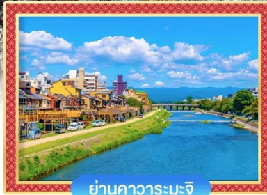
ย่านคาวาระมะจิ