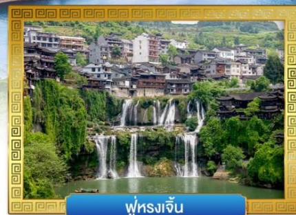
ฟูหลงเจิ้น