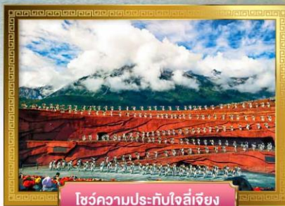
โซ่วความประทับใจลี่เจียง