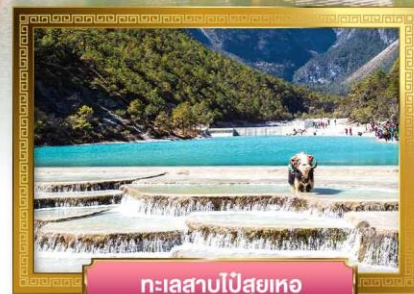
ทะเลสาบไป๋สฺยเหอ