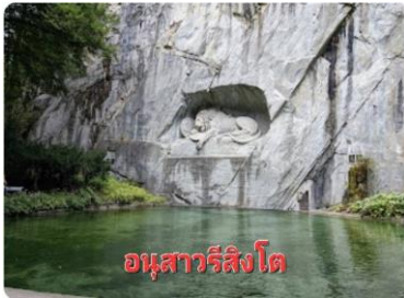
อนุสาวรีย์สิงโต

เช้า รับประทานอาหารเช้า ณ ห้องอาหารโรงแรม