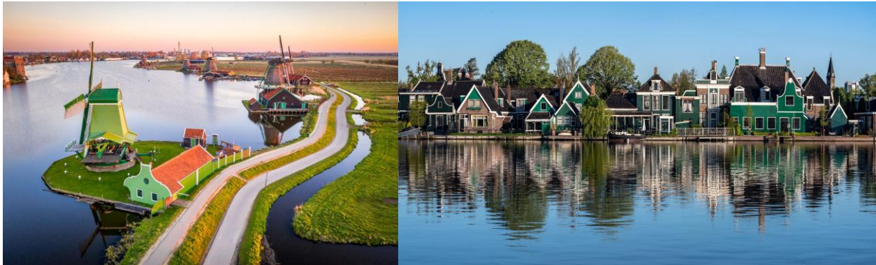
เนเธอร์แลนด์เก็บไว้เป็นที่ระลึก

นำท่านเดินทางสู่ หมู่บ้านชานสคาน (Zaanse Schans) ให้ท่านได้ถ่ายรูปสัญลักษณ์ของประเทศ